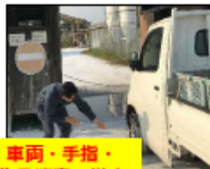
車両・手指・物品消毒の徹底