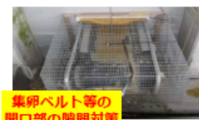
集卵ベルト等の開口部の隙間対策