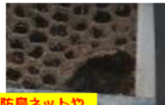
防鳥ネットや鶏舎破損の補修

異状をみつけた場合には直ちに山梨県東部家畜保健衛生所まで 電話・・・055-262-3166 FAX・・・055-262-3108 夜間、土日・休日の連絡は・・・090-5535-8005・090-5544-7868