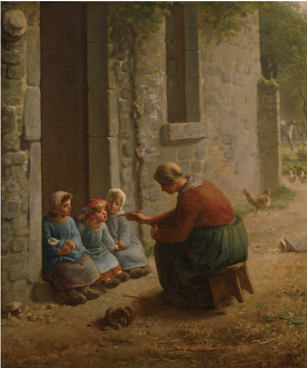
《子どもたちに食事を与える女（ついばみ）》 1860年 油彩・カンヴァス リール美術館蔵