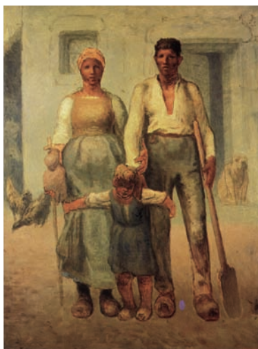
《農民の家族》1871-72年 油彩・カンヴァス ウェールズ国立美術館蔵 Lent by Amgueddfa Cymru - National Museum Wales