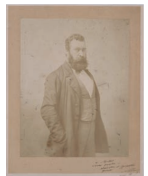
ナダール《ミレーの肖像》1868年 銀塩写真

今年、フランスの画家、ジャン＝フランソワ・ミレー（1814―75年）の生誕200年に当たります。自然を愛し、日常の生活の中に美しさを見いだした彼の作品は、時代も国境も越えて、豊かな自然と共に暮らす私たち山梨県民の心に訴え掛けてきます。開館から35年間、「ミレーの美術館」として親しまれてきた県立美術館で、あらためてミレー絵画の魅力に触れてみませんか。