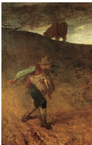
《種をまく人》1847-48年 油彩・カンヴァス ウェールズ国立美術館蔵 Lent by Amgueddfa Cymru - National Museum Wales