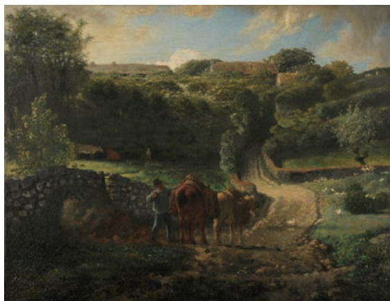
《クーザン村》1854-73年 油彩・カンヴァス ランス美術館蔵