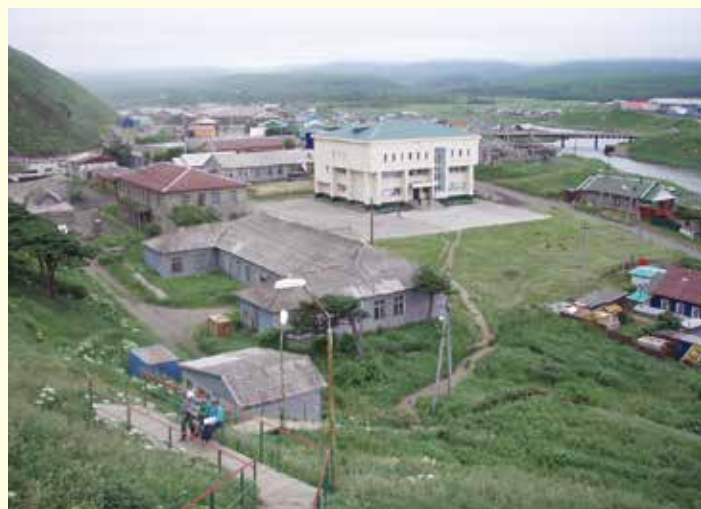
紗那(しゃな)の中心街 [ 択捉島 ]

わたし、北方領土 イメージキャラクターの 「エリカちゃん」 エトピリカの女の子だピー～ よろしくね♪