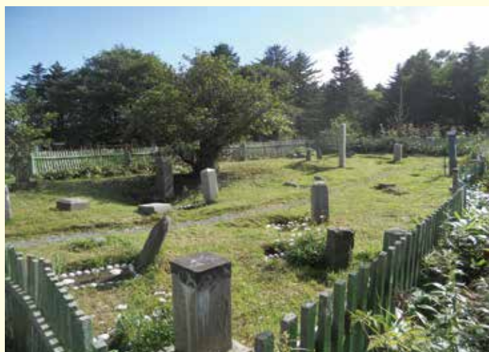
古釜布(ふるかまっぶ)の日本人墓地 [ 国後島 ]