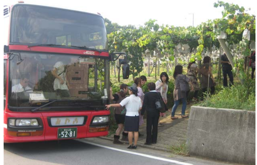
② 韮崎市穂坂町の観光農園