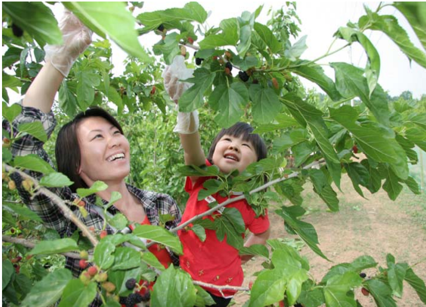
③ 甲斐市大袋 桑の実摘み体験