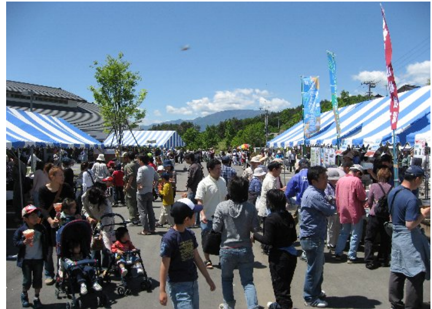
④ 甲斐市牛句 梅の里ふれあいまつり