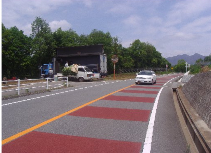
① 韮崎市穂坂町地内の利用状況