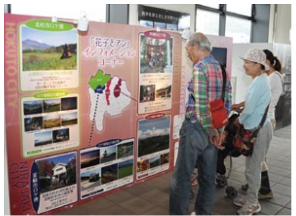
「花子とアン」ロケ地と周辺の観光地を紹介するパネル