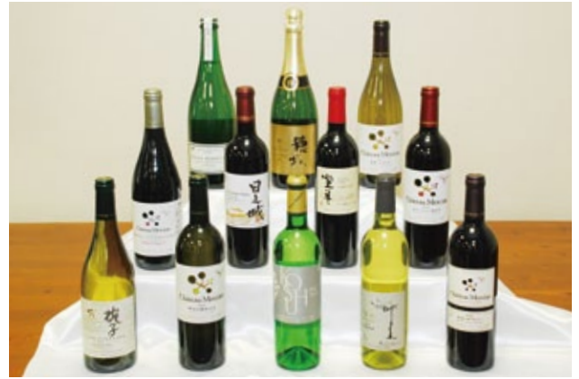
県内ワイナリーで醸造された金賞ワイン12点

国産ワインコンクール開催 産ブドウのみを原料とするワインを対象にした「国産ワインコンクール2014」が開催されました。 今回は、全国のワイナリーから過去最多となる797点が出品され、7月下旬に甲府市内で審査会が行われました。その結果、396点が入賞。金賞に輝いた25点のうち、12点は県内ワイナリーで醸造されたものです。 今年は審査結果の発表を、従来からの山梨会場に加えて東京会場でも行い全国に向けた情報発信の強化を図りました。