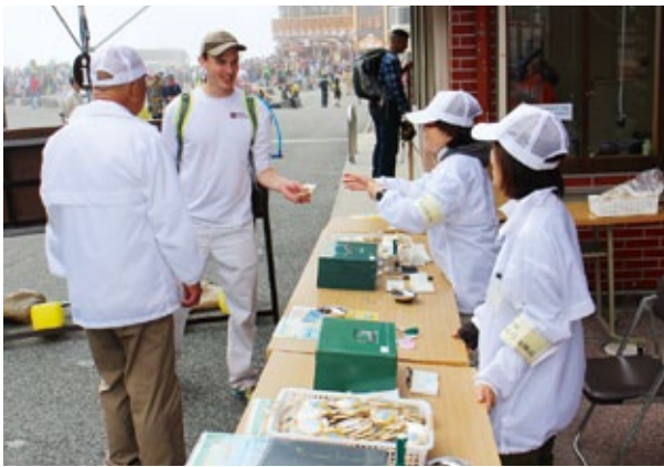
吉田口登山道の五合目総合管理センター前で協力金を支払う登山者

集めた協力金は、トイレの新設や改修、救護所の拡充など、環境保全や安全対策に使用します。