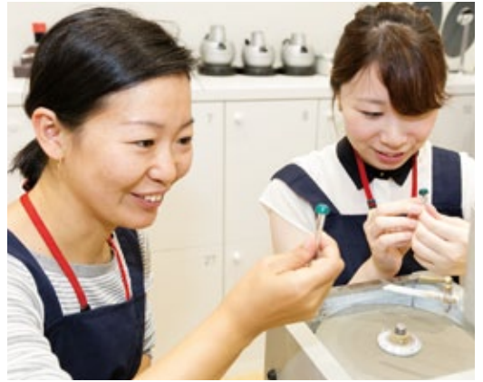
山梨ジュエリーミュージアムで、職人の指導を受けながら研磨体験を行うツアー参加者