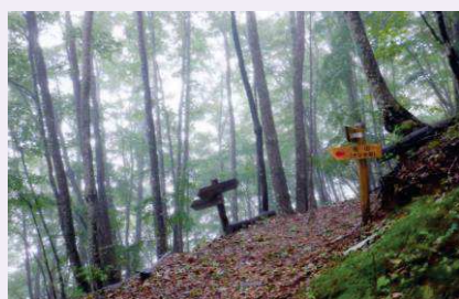
鶴峠・オマキ平分岐の状況