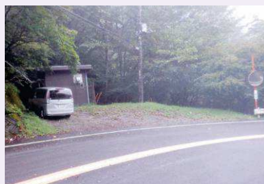
鶴峠頂上部の駐車スペース