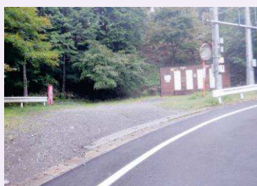
鶴峠設置のトイレの状況