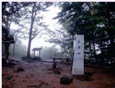
三頭山山頂の状況