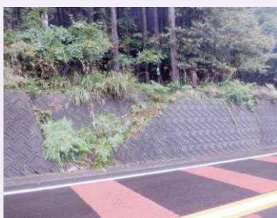
三頭山登山口の状況