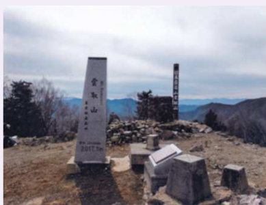
三頭山山頂の状況

全体を通して、携帯電話等の通信手段が圏外となることから、 登山計画書の提出 事前に家族等への行先の連絡 グループ等複数人での登山 十分な装備品 余裕を持った登山計画 等をよろしくお願いします。