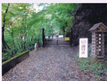
林道後山線に設置された ゲート

国道411号線お祭りから後山林道への入口は、分かりづらい脇道となっています。後山林道に入ると、携帯電話の電波が圏外となるので、「ヤマップ」等の登山アプリを起動しておく便利です。