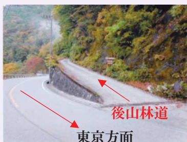
東京方面 国道411号線お祭りから 林道後山線へ入る場所