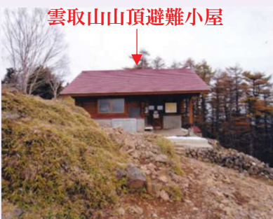
雲取山山頂避難小屋

雲取山山頂避難小屋には、トイレが設置してあります。 七ツ石小屋コースとの分岐となっているので、一見して山頂に見えるので注意して下さい。