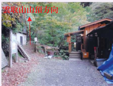
三条の湯トイレ及び雲取山山頂方面の登山道