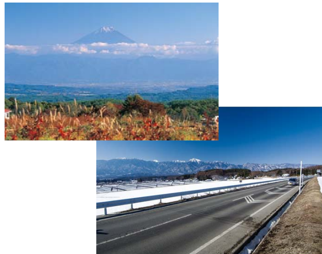
⑤ 良好な景観の創出 北杜市のすばらしい景観「北杜24景」に選定され HPに公開されるなど、観光資源として位置づけ られている。