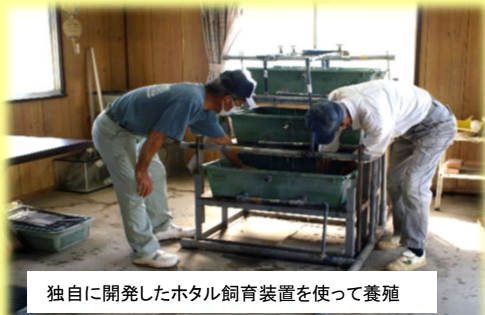
独自に開発したホタル飼育装置を使って養殖