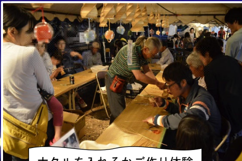
ホタルを入れるかご作り体験