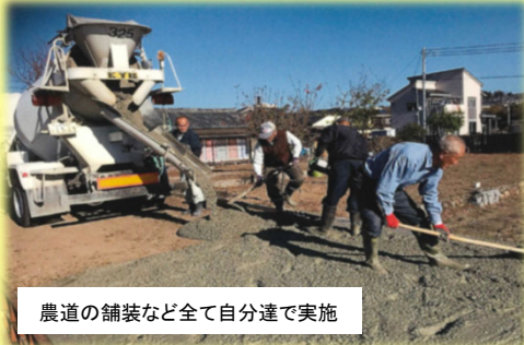
農道の舗装など全て自分達で実施