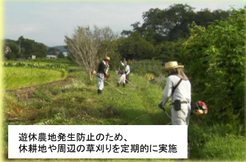
遊休農地発生防止のため、休耕地や周辺の草刈りを定期的にも実施