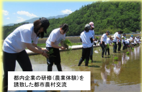
都内企業の研修（農業体験）を誘致した都市農村交流