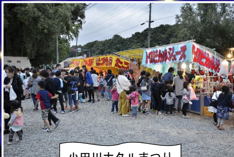
小田川ホタルまつり