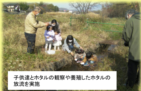
子供達とホタルの観察や養殖したホタルの放流を実施