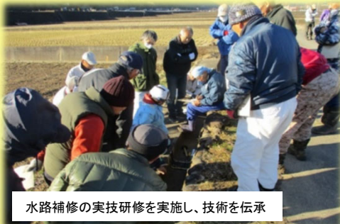
水路補修の実技研修を実施し、技術を伝承