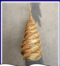
完成した ホタルを入れるかご

小田川地区のホタルの見頃時期は6月上旬～中旬ごろ。「日没から2時間後」がホタルの活動時間のピークといわれており、20～21時の間がおすすめの観賞時間です。ゲンジボタルの体長は12～15ミリあり、強い光を2～4秒おきにゆっくり出すのが特徴です。