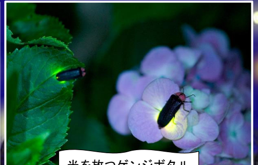
光を放つゲンジボタル