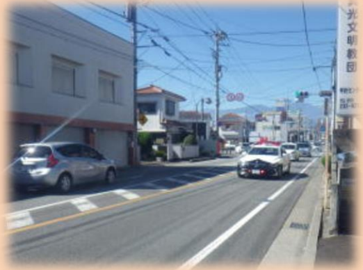
② 街頭啓発活動（レッド走行）