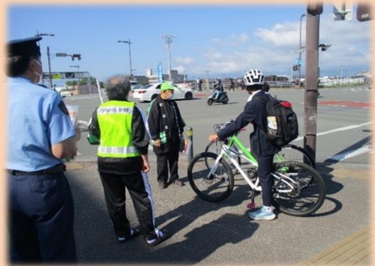
④ 街頭啓発活動（自転車）