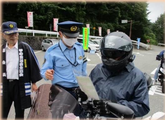
③ 街頭啓発活動（二輪車）