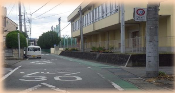
① ゾーン30による交通規制