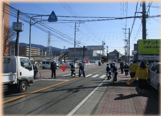
⑤ 街頭啓発活動（歩行者）