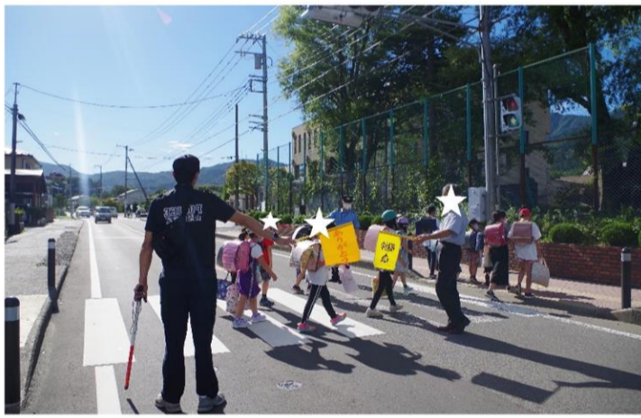
通学路における見守り活動