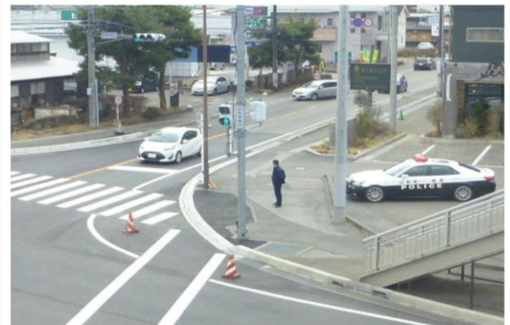
交差点における交通取締り