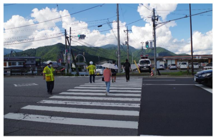
交通事故多発場所における街頭活動