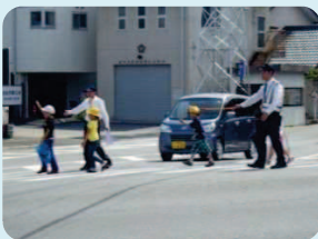
通学路での街頭指導