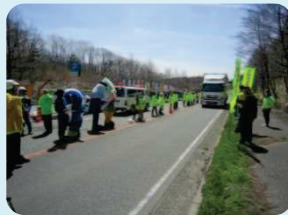
街頭指導所の開設