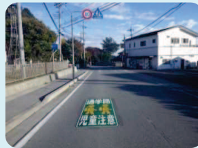
減速を促す道路標示等の整備