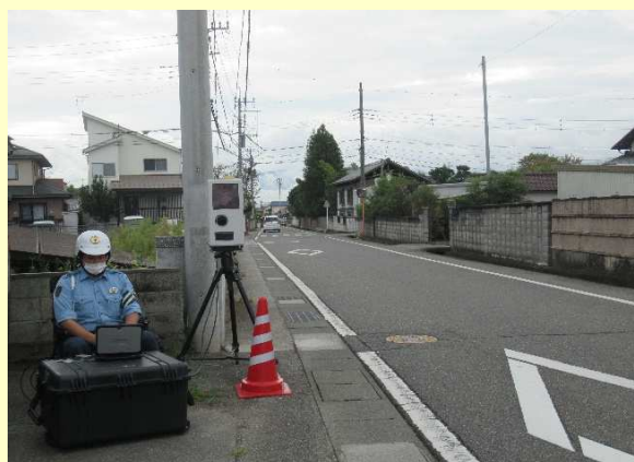
通学路での速度取締りの実施状況