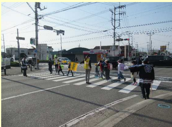
通学路における街頭活動の状況