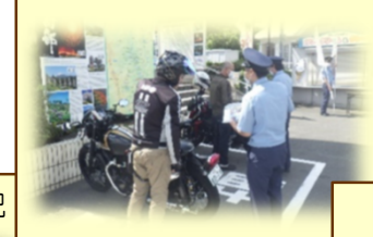
通学時間帯の立番状況