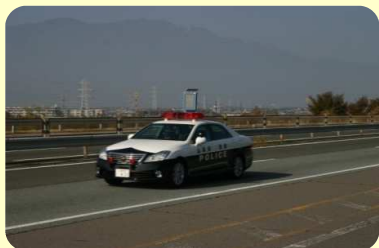
【パトロールの強化】