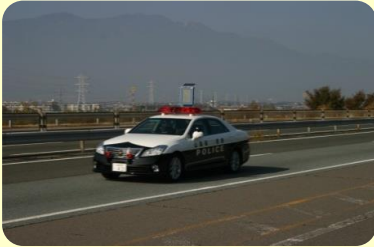
【パトロールの強化】