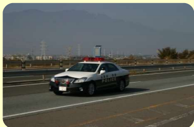
【パトロールの強化】