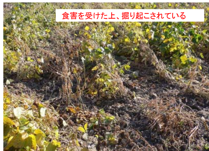
③イノシシによる被害を受けた「あけぼの大豆」の畑