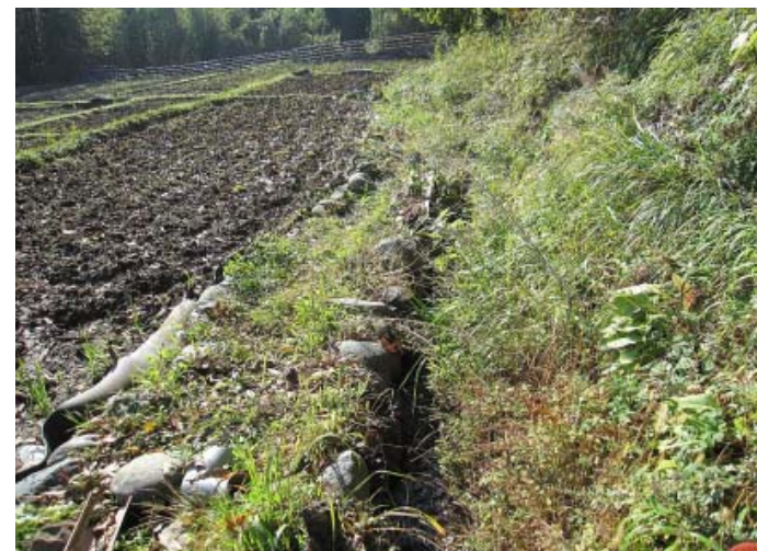
②未整備のため漏水が多く、用水供給が困難な農業用水路