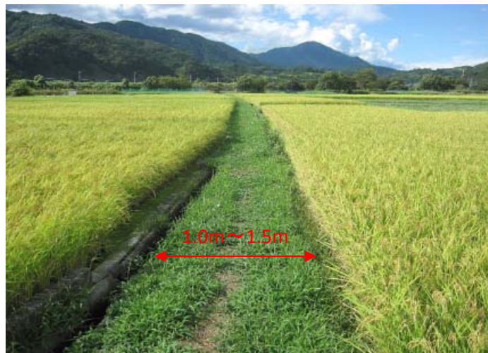
①道路幅が狭小な上、未舗装のため農業資材の搬入や農産物の搬出が困難な農道