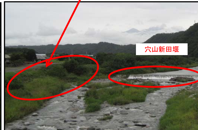
③右岸堤防に洗掘の恐