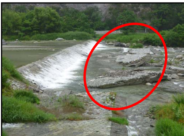
②護床工・水叩きの損傷