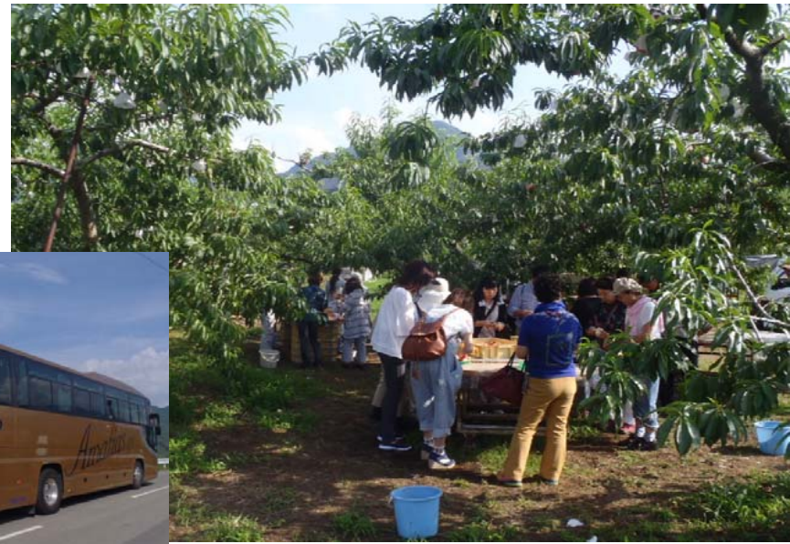
③大型バスによる観光客で賑わう桃畑