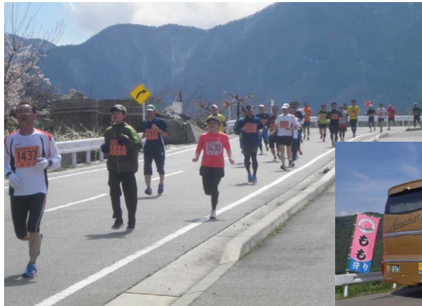
②基幹農道を使った桃の里マラソン大会