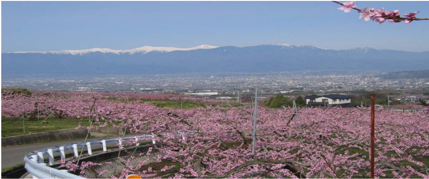
①石工区からの甲府盆地を見た眺望