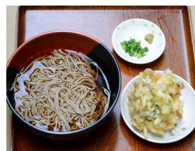
かき揚げそば 530円(税込) 506cal 大盛630円(税込) 654kcal