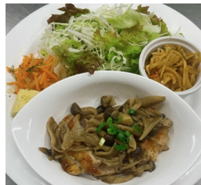
ローストチキンの きのこソース867kcal