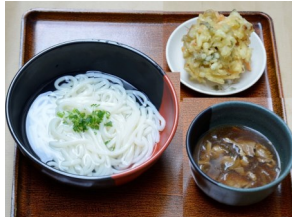
かき揚げ付き 富士栂ポークうどん 630円(税込) 557kcal 大盛730円(税込) 688kcal