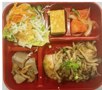
ローストチキンのきのこソース867kcal