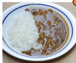
無添加野菜カレー 660kcal 530円(税込)