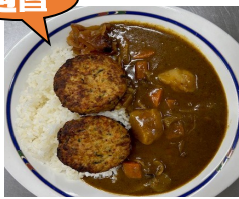
ハンバーグ入 無添加野菜カレー 650円(税込) 933kcal