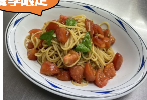
フレッシュトマトと バジルの冷製パスタ 650円(税込) 826kcal