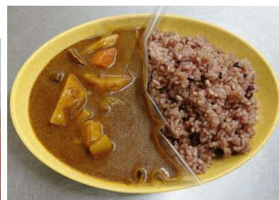
無添加野菜カレー 660kcal 530円