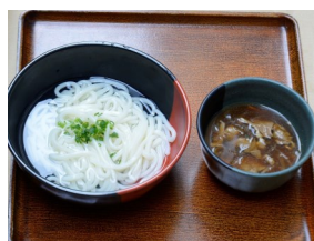
富士栂ポークうどん 530円(税込) 408kcal