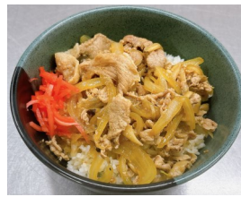
富士栂ポークの 豚丼621kcal 580円(税込)