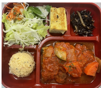
ハンバーグの野菜煮込み風 897kcal