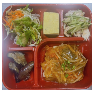
タラの野菜あんかけ 844kcal