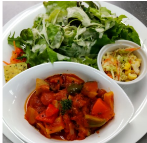
ハンバーグの野菜煮込み風 967kcal