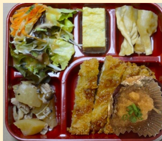
火曜日の日替り弁当

★日替り弁当 550円(税込) ライス大盛は+50円・小盛-20円・ライス無し-60円