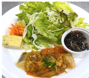
タラの野菜あんかけ 744kcal