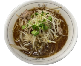
富士栂ポークとモヤシ タップリラーメン 550円(税込) 798kcal