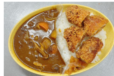
ハンバーグ入無添加野菜カレー 650円 964kcal 写真例