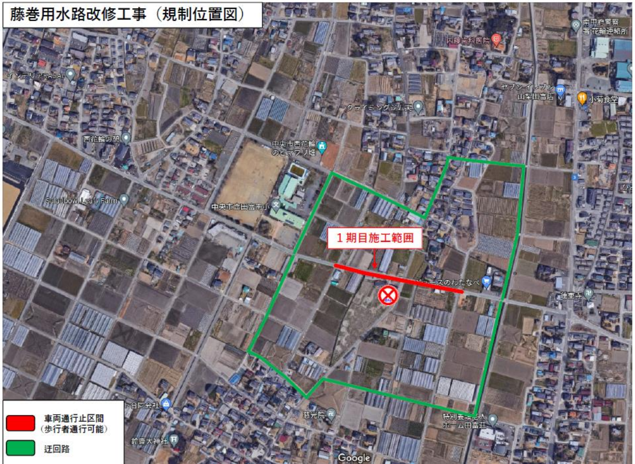
藤巻用水路改修工事（規制位置図）