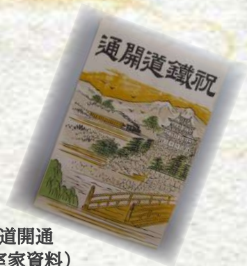
祝鉄道開通

甲州市塩山出身であり、 甲州財閥のひとりでもある実業家 雨宮敬次郎。 中央本線敷設や全国各地の鉄道事業に関わり、 「明治の鉄道王」とも評される。 自費で中央線敷設予定地を実測したり、 自身の還暦のパーティーに現在の価値で 何億円もの費用をかけたりと、 そのまっすぐで豪胆な性格は、 現在を生きる私たちからみても 魅力的な人物に感じる。 本講座では、雨宮敬次郎の生涯について、 とくに鉄道事業を中心に紹介する。