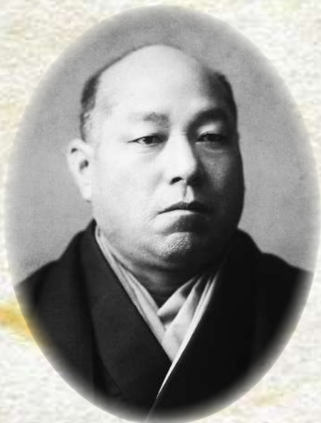
雨宮敬次郎 『過去六十年事蹟』明治40年

甲州市塩山出身であり、 甲州財閥のひとりでもある実業家 雨宮敬次郎。 中央本線敷設や全国各地の鉄道事業に関わり、 「明治の鉄道王」とも評される。 自費で中央線敷設予定地を実測したり、 自身の還暦のパーティーに現在の価値で 何億円もの費用をかけたりと、 そのまっすぐで豪胆な性格は、 現在を生きる私たちからみても 魅力的な人物に感じる。 本講座では、雨宮敬次郎の生涯について、 とくに鉄道事業を中心に紹介する。