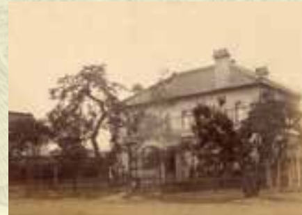
栗原信近が頭取を務めた第十国立銀行(甲府市)