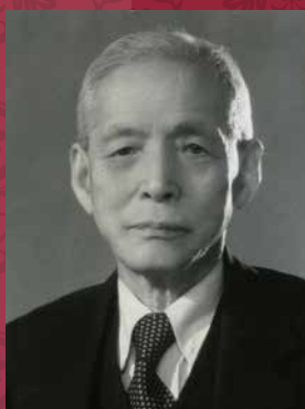
小林 一三 Ichizo Kobayashi