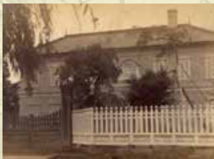
八巻九萬の議長としての舞台ともなった県会議事堂