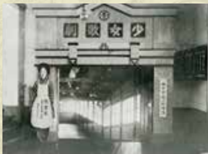
宝塚少女歌劇の劇場入口 (『宝塚少女歌劇二十年史』より)