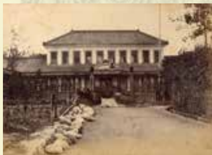
明治時代の河原部高等小学校(韮崎市)