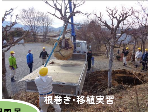
根巻き・移植実習