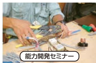
能力開発セミナー