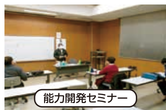
能力開発セミナー