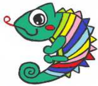
就業支援センター イメージキャラクター "しゅうくん"

FAXで申込の場合は、送信後、確認の電話をお願いします。 FAX・電子申請とあわせ先着順で受講者を決定します。 ただし、受付開始日に申込者が定員を超えた場合は、この日の申込者全員について抽選で受講者を決定します。 また、受講申込みが少ない場合は、実施しない場合があります。 受付終了後、受講者あてに受講案内(受講決定通知)と受講料納入通知書(振り込み書)を郵送します。 受講料は、納入期限までに金融機関での納入をお願いします。