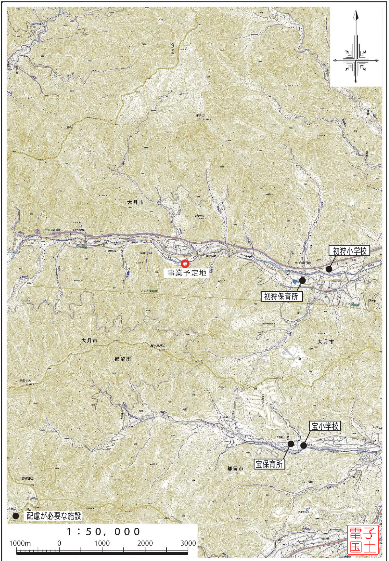
図 4-2-3 配慮が必要な公共施設位置図