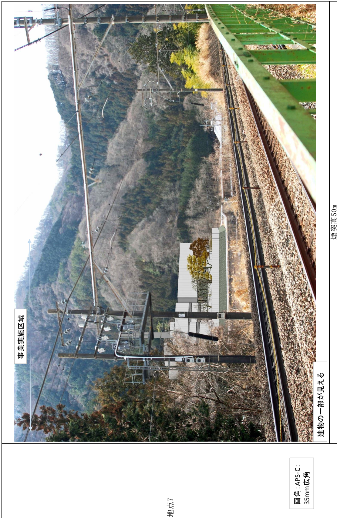
図 9-15-21 (4) 景観予想図(原地区沿道 地点7、煙突高 50m)