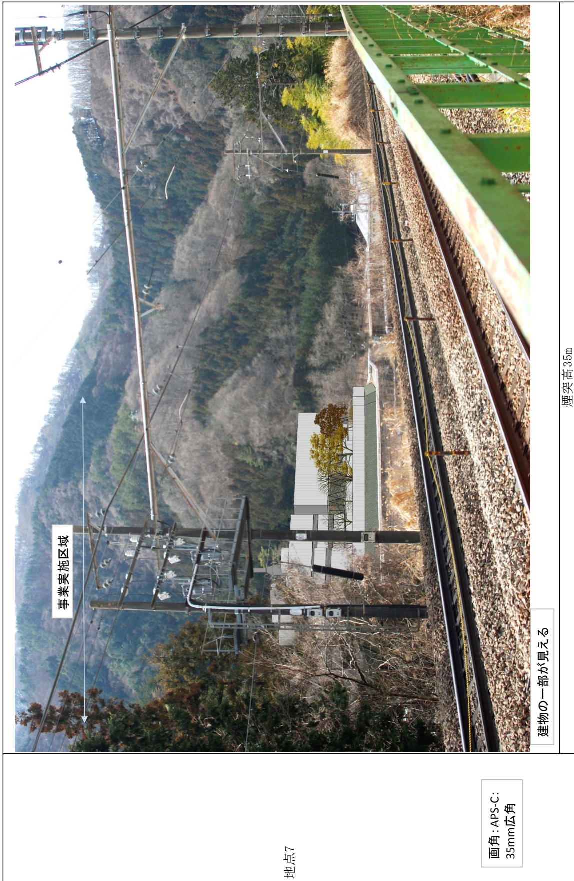
図 9-15-21 (3) 景観予想図(原地区沿道 地点7、煙突高 35m)