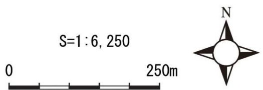
図 9-15-21(1) 景観地点位置図 (原地区沿道 地点7)