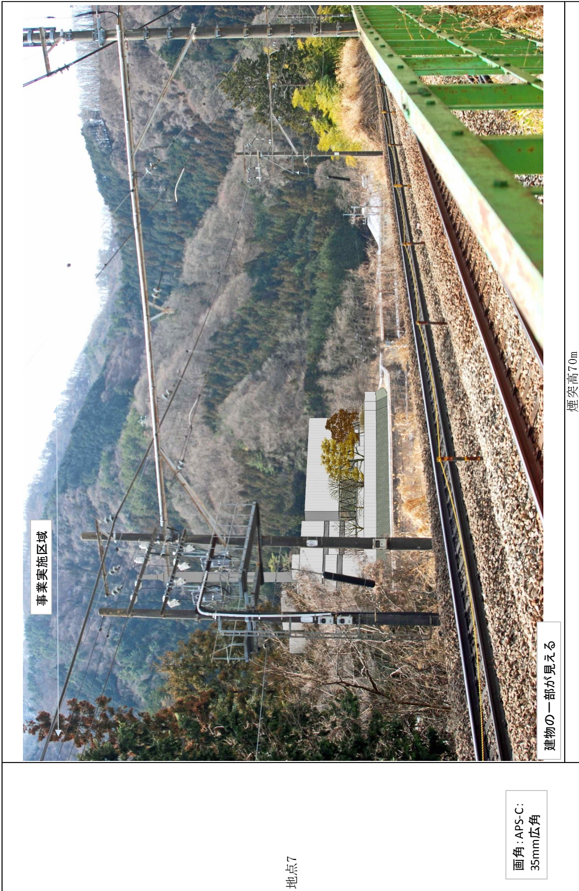
図 9-15-21 (5) 景観予想図(原地区沿道 地点7、煙突高 70m)