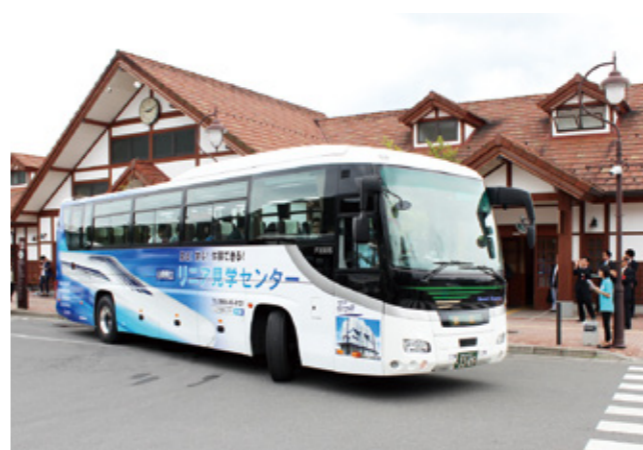
走行試験に使用されているLO(エル・ゼロ)系車両が描かれたラッピングバス

県 立リニア見学センターでは、首都圏などからのさらなる誘客を目指し、リニア車両がデザインされたPRラッピングバスの運行を開始しました。 7月18日には、河口湖駅で出発式を行い、初走行する高速バスに次々と乗客が乗り込みました。また車両を撮影する姿も多く見られ、リニアへの関心の高さがうかがえました。 現在、新宿～富士五湖線を走る高速バス1台と、富士五湖周辺を走る路線バス1台が運行しています。