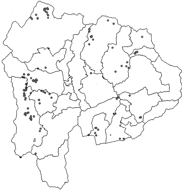
図2 報告された死亡個体の位置

山梨県内で報告されたニホンジカの死亡個体は214個体、その位置は図2のようであった。南アルプス市や早川町で多い傾向が認められた。