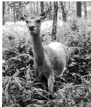
オスで角の先端数 4