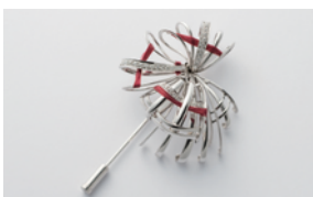
〈ギシュウ〉ブローチ デザイン：大森弘子 制作：小椋欣三