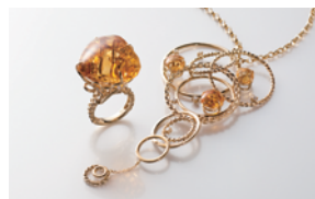
〈編む -tricot-〉ペンダント・リング デザイン：飯島恵子 制作：株式会社光新宝飾