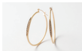
〈ラインフォルム〉ピアス 制作：株式会社工房グリーン