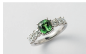
リング 制作：株式会社白金工房