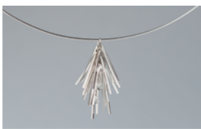
〈Mino〉ペンダント デザイン：大城千里 制作：株式会社イノウエ