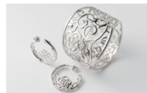
〈Rosery (薔薇の庭)〉バングル・ピアス デザイン：小林由紀 制作：島津浩明