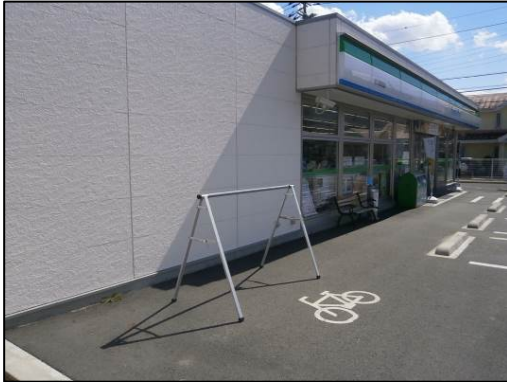
図- 4.36 富士河口湖町内のコンビニで設置されているラック