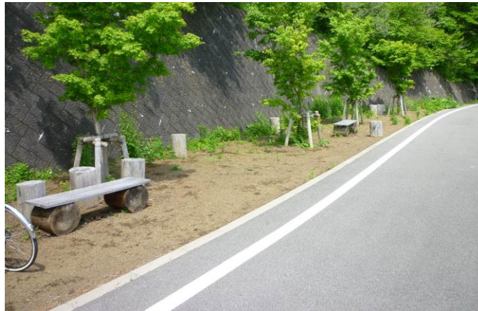
図- 4.38 山中湖湖畔に設置されたベンチ