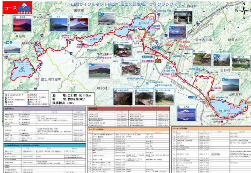
図- 4.34 ホームページに掲載するサイクリングマップのイメージ