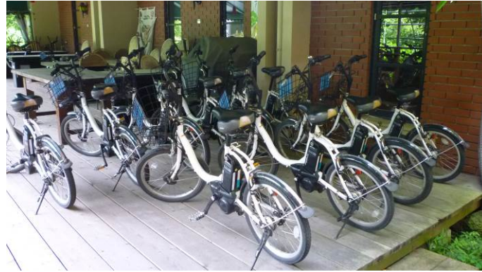
図- 4.43 富士河口湖湖畔のレンタサイクル