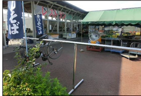
図- 4.37 他県の道の駅で設置されているラック