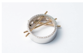
〈Muse〉リング デザイン：雪江美恵子 制作：(株)山宝