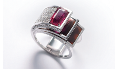
Koo-fu COLLECTION 2015 〈表情の魅力（直線と曲線のバランス）〉

※Koo-fu とは… 山梨県の地場産業であるジュエリー産業の活性化を目指し、2005 年にスタートしたプロジェクト。2008 年よりコレクションを発表し、山梨県の優れた技術・素材・デザインを広く国内外に発信している。