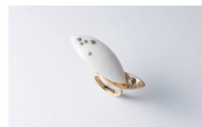
〈雪・月・花〉リング デザイン：伴野裕子 制作：ジュエリークラフトフカサワ 深澤陽一 クボタジュエリークラフト(株)