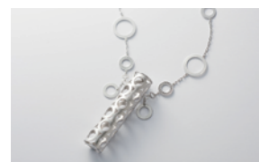
〈リップケース・ペンダント〉 デザイン：小澤恭子 制作：(有)望月クラフト 望月明