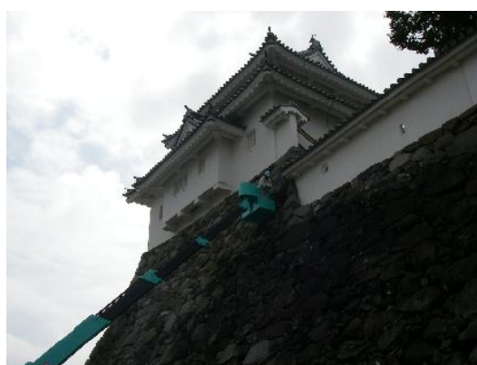
写真：高所作業車を使った点検作業