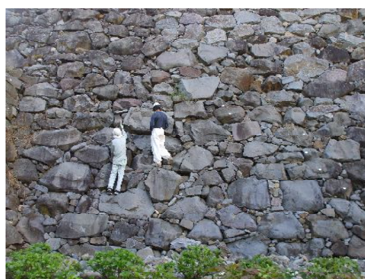
写真：職人による確認作業