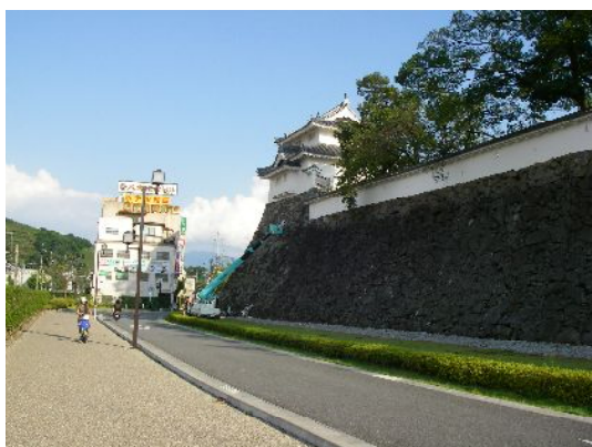
写真：修繕工事実施地点

改修済みの維持管理工事を実施しました。具体的な作業としては、詰石の緩みや破損に箇所について石材の「締め堅め」や「交換」、「剥離」作業を行いました。石垣10mを超える所もあるので、高所作業車を使用して点検作業を行いました。