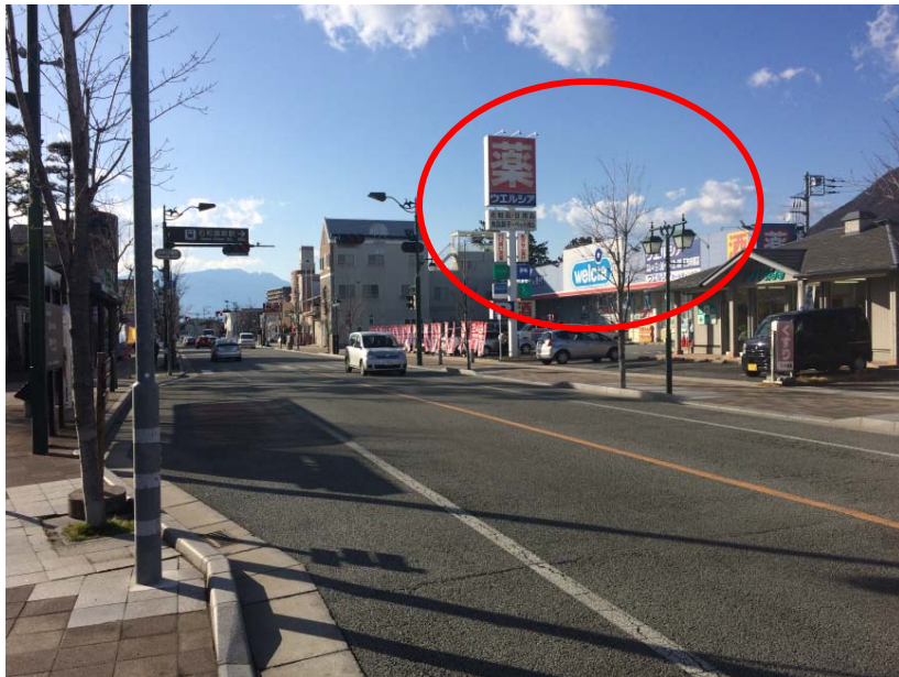
方針と外れた建築物 (屋外広告物等)