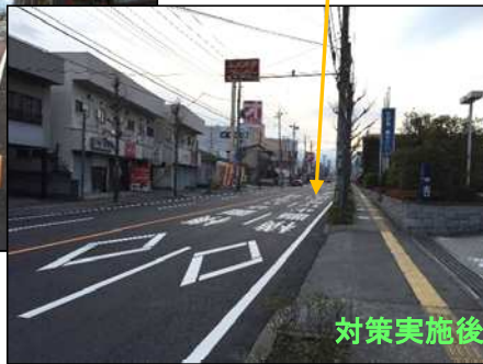
横断歩道車前路面標示