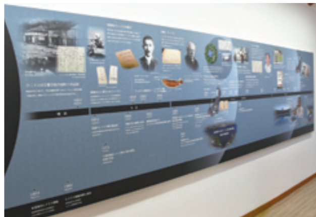
クニマス年表パネル