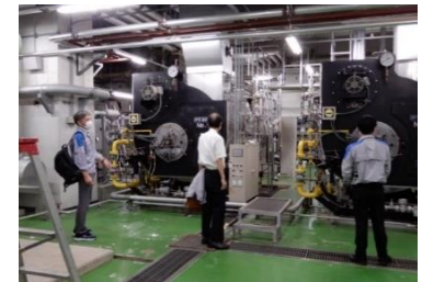
県有施設のエネルギーシフト (派遣元企業による調査)