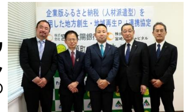
人材派遣に係る連携協定式