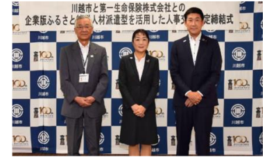
人材派遣に係る協定式 (川越市)