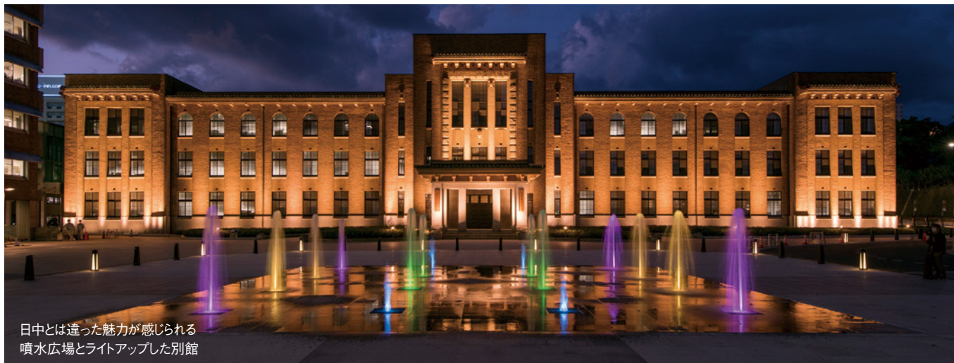
日中とは違った魅力が感じられる 噴水広場とライトアップした別館