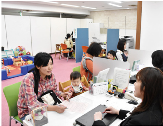
キッズスペースも設置しているので、子ども連れの方も安心して相談できる

富士・東部地域には、これまで育児中の母親の就労を支援する機能がなかったため、多くの方々が訪れることを期待しています。