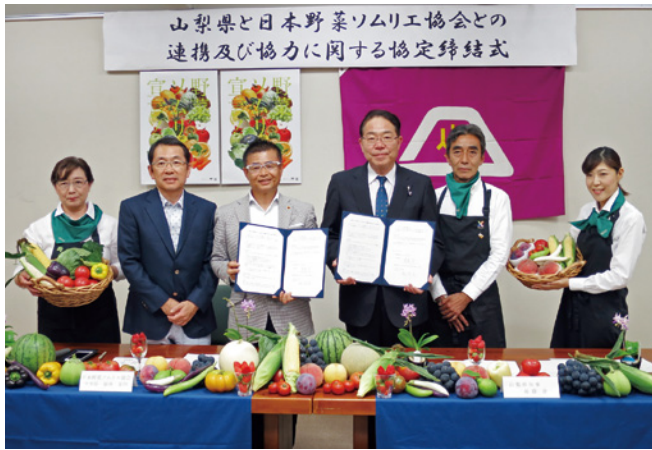
連携協定締結式では県産農産物をPR