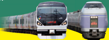
特急「かいじ」・「あずさ」 特急「スーパーあずさ」

※インターネット限定商品です。※通常のきっぷに比べ、変更、払戻などご利用条件に制限がありますのでご注意ください。 ※こどもの設定もごさいます。※きっぷのお受取り後の払い戻しには割引率分の手数料がかかります。