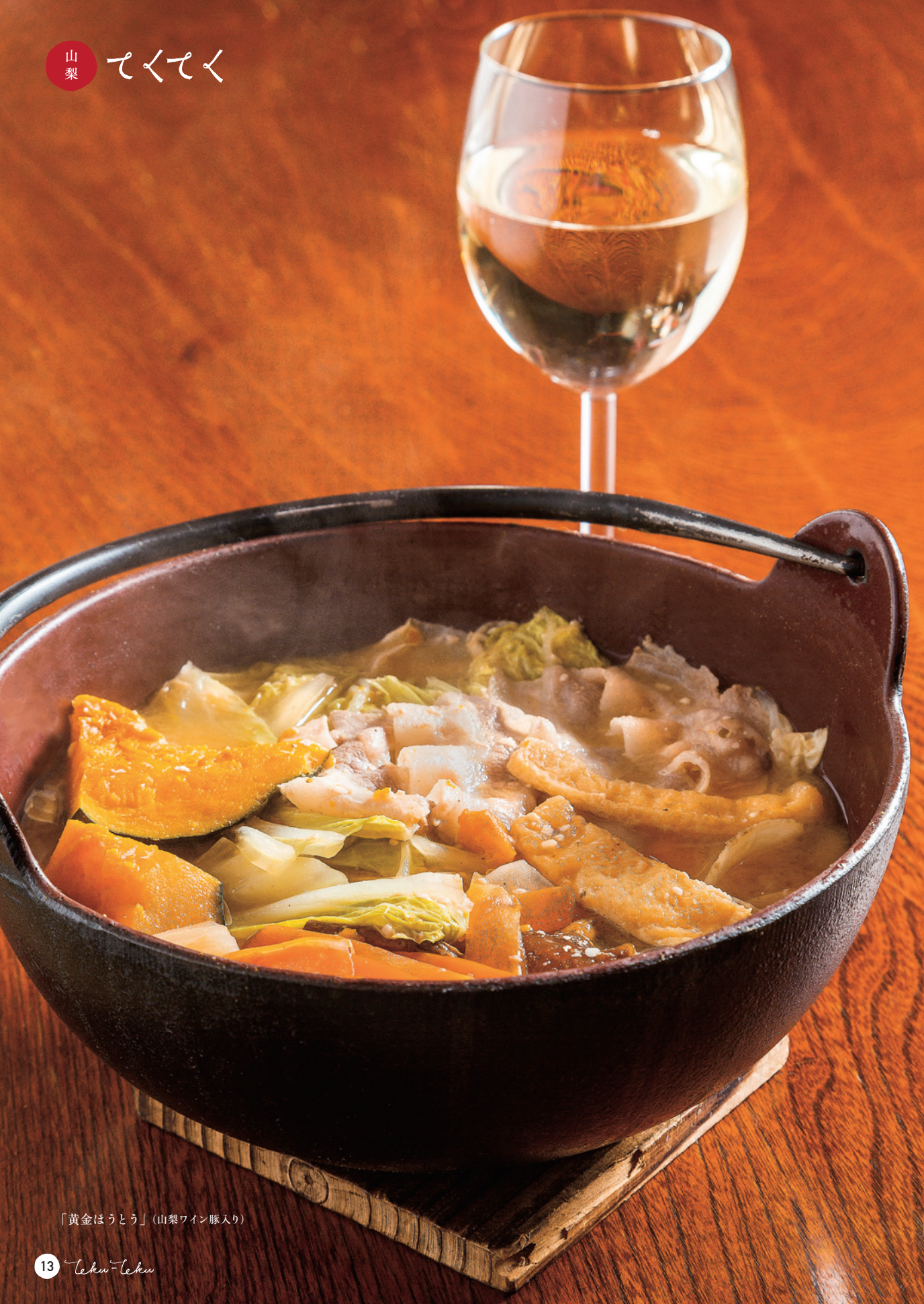
「黄金ほうとう」(山梨ワイン豚入り)