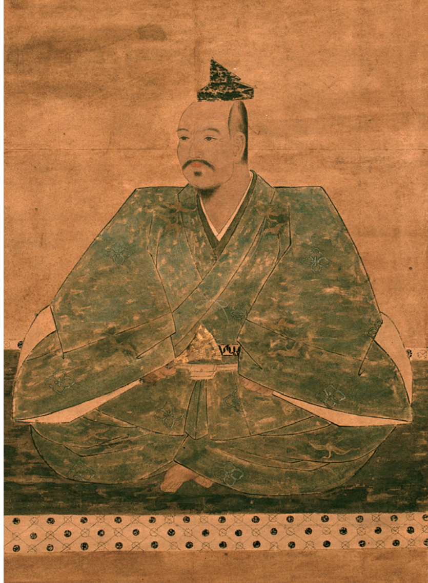
武田晴信公画像(武田神社 所蔵)