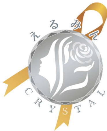
「クリスタルえるみん」認証マーク