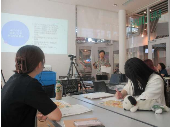
高校生・大学生と