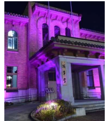
(写真: 上から) 藤村記念館、ココリ、県議会議事堂