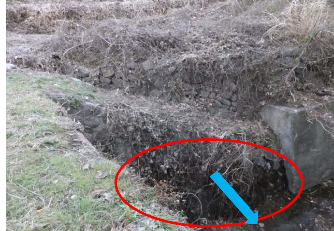
② 堤体からの浸出し状況。