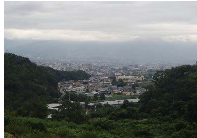
④ ため池下流の状況。 堤体下流には人家があり、大型地震の際には甚大な被害のおそれがある。