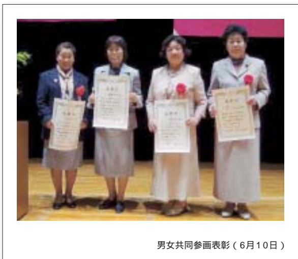
男女共同参画表彰(6月10日)