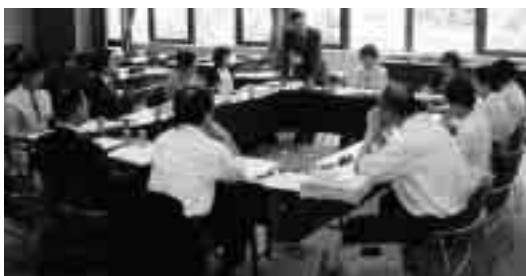
防災・安全安心対策班