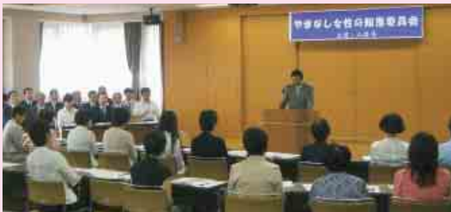
やまなし女性の知恵委員会委嘱式（8月7日）