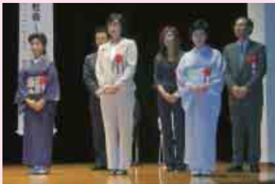
男女共同参画推進事業者等表彰（6月8日）