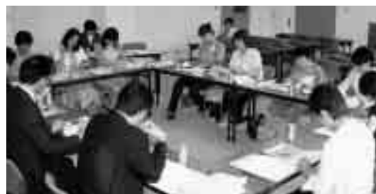
農業農村の活性化班