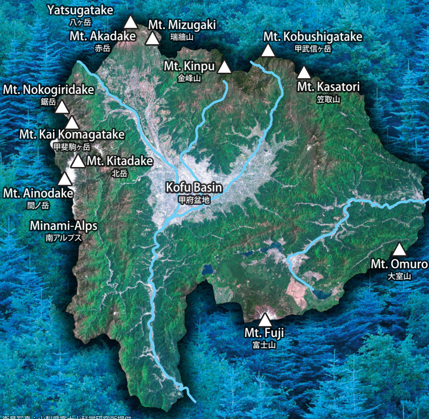
衛星写真：山梨県富士山科学研究所提供

豊かな水は豊かな森林が育みます。山梨県は富士山や南アルプスなどの山々に囲まれ、県土の78%を森林が占める緑豊かな地です。国際的な森林管理認証(FSC®森林管理認証)を取得した森林面積は日本一を誇ります。私たちは、この恵み豊かな森林の保全に努めています。