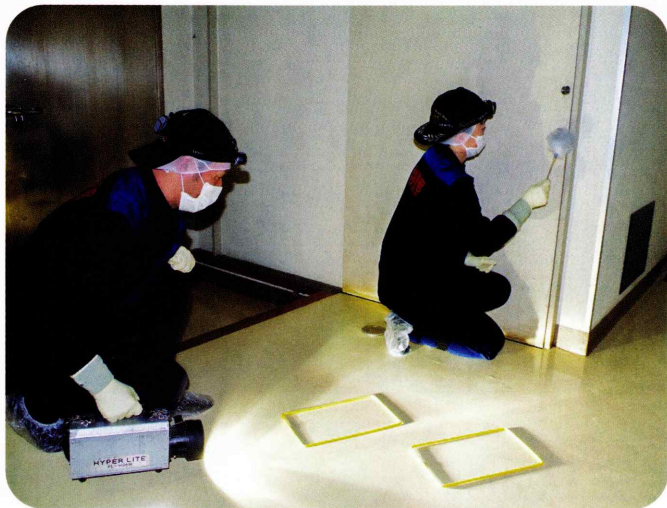
犯罪現場における鑑識活動

鋭敏な嗅覚を有する警察犬は、逃走した犯人の追跡や遺留品の検索、行方不明者の搜索等で活躍しています。