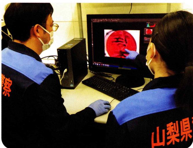
文書係による印章鑑定

科学捜査研究所では、法医学、化学、機械、電気、心理学等の専門知識や分析技術を有する職員が、DNA型鑑定、薬物・毒物の分析、火災や交通事故の原因究明、筆跡鑑定、ポリグラフ検査、犯罪者プロファイリング等の科学捜査を担当しています。