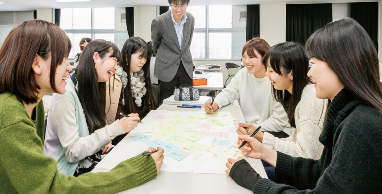
山梨の魅力について意見を出し合う、山梨大学の学生たち(上)