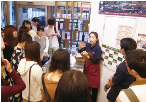
東京にある山梨のアンテナショップを視察し、地場産品のPR手法を学ぶ(下左) 甲州市のブドウ畑を調査するゼミ(下右)