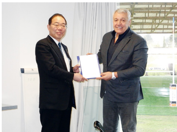
協定書を披露する、フランスラグビー協会幹部と後藤知事

県では、東京オリンピックの開催をスポーツ・経済の振興につなげるため、事前合宿誘致を進める市町村を今後積極的にサポートしていきます。