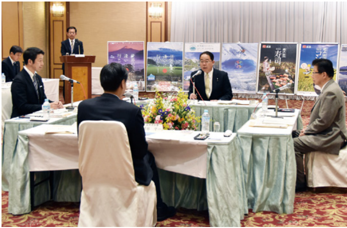
連携して取り組む施策などについて意見を交わす各知事