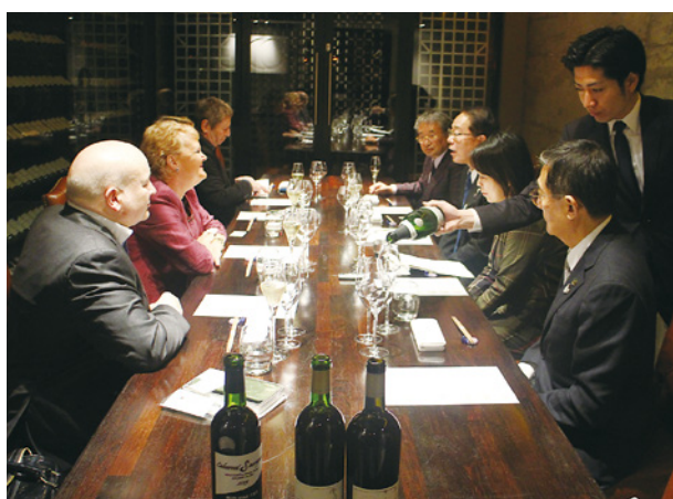
甲州ワインの魅力やソムリエやワインジャーナリストなどに説明する後藤知事ら

参加者からは、甲州ワインに対して「全体のレベルが上がった印象がある」、「東京オリンピックを契機に大きく飛躍する可能性を秘めている」など高い評価を受け、甲州ワインの国際的認知度向上と輸出促進に向け、大きな手応えを得ました。